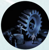
Integration der gesamten Anlage

Ein intuitives Bedienungskonzept verfolgt den Ansatz, dass sich der User schnell zurechtfindet und Informationen schnell und einfach findet. b-connected ist auf jedem webfähigen Endgerät verfügbar, egal ob PC, Tablet oder Smartphone. Der Anlagenbetreiber hat seine Anlage über Echtzeitdaten im Blick, erkennt Stillstandsursachen und kann gezielt Maßnahmen setzen, um die Anlagenverfügbarkeit zu erhöhen und gleichzeitig Stillstandszeiten zu reduzieren.