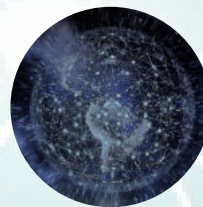
Daten sind jederzeit griffbereit