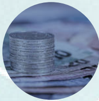
Minimierte Anlagen- ausfallkosten