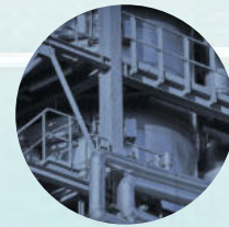
Zentrale Steuerung der Wartung

Zusätzlich stehen Mitarbeitenden relevante Dokumente, wie Maschinen- oder Anlagendokumentationen, Schulungsunterlagen und Fotos von Rundgängen, zentral zur Verfügung. Wartungsaktivitäten können geplant, koordiniert und protokolliert werden. Durch die gute Koordination der Services werden Betriebs- und Anlagenausfallkosten minimiert.